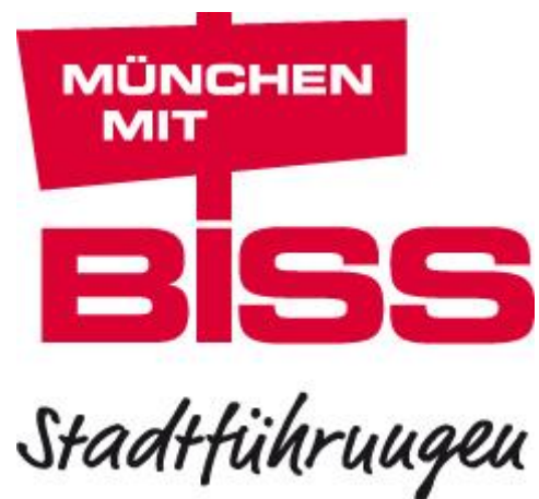
(Abbildung 6: Logo (München mit-)BISS-Stadtführungen)

Es kann zwischen drei Führungen ausgewählt werden: 'BISS und Partner', 'Wenn alle Stricke reißen...', und 'Brot und Suppe, Bett und Hemd'. 14 15