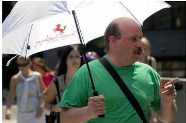
(Abbildung 4: Stadtführung „Im Focus“)

Trott!war-Verkäuferinnen und Verkäufer 12 haben die Tour selbst zusammengestellt. Sie führen an Plätze, an denen sie selbst einige Zeit verbrachten. Brennpunkte wie Einrichtungen der Wohnungslosen- und Suchtkrankenhilfe sind Inhalt der zwei- bis dreistündigen Tour. Mit dieser Stadtführung erhalten sozial benachteiligte Menschen bei Trott!war eine weitere Möglichkeit, neben dem Heftverkauf, etwas zu verdienen und einer sozialversicherungspflichtigen Beschäftigung nachzugehen. Als Stadtführer nehmen sie eine neue Rolle ein: Sie sind jetzt die Experten.