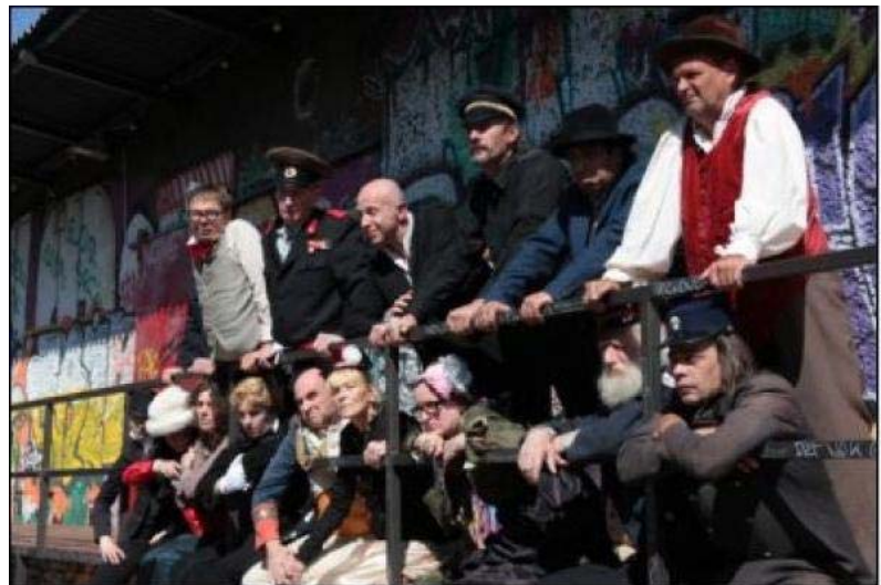
(Abbildung 9: Theatergruppe „Die Ratten“ 20 )

Für das Theaterprojekt 'Pest' in Berlin wurden neben professionellen Schauspielern auch Obdachlose integriert. Eine Fortsetzung der Theaterarbeit mit Obdachlosen war zunächst nicht vorgesehen. Um nicht ins 'Nichts' zurück kehren zu müssen, schlossen sich die Obdachlosen, die nun schon Theatererfahrung sammeln konnten, zur Theatergruppe 'Die Ratten' zusammen. 2012 können 'Die Ratten' auf fünfzig Produktionen zurück blicken. 19