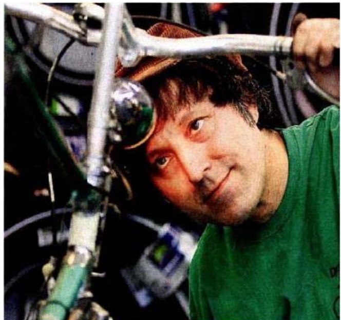
(Abbildung 29: Beleuchtungskontrolle in der Werkstatt vom Dynamo Fahrradservice)

Dynamo Fahrradservice bietet 22 Arbeitsplätze für ehemals langzeitarbeitslose Menschen, die sich als Fahrradmechaniker, Lagerverwalter und Bürokraft qualifizieren. Der Dynamo Fahrradservice ist ein Projekt der BISS Bürger in sozialen Schwierigkeiten e. V. in München, welcher auch Herausgeber der Münchener Obdachlosenzeitung BISS ist. 83