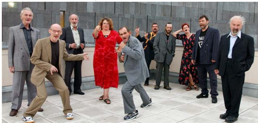
(Abbildung 12: Erster Wiener Obdachlosenchor 'Stimmgewitter')

Die singenden Augustin 27 -Verkäufer präsentieren Schlager, neu interpretiert und in A-Capella.