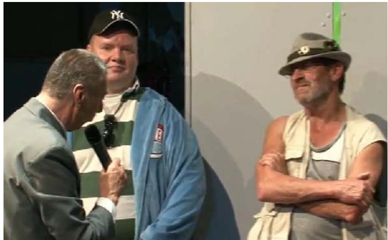
(Abbildung 10: Screenshot vom Theatermitschnitt „Nachbarn“ 22 )

Im Brückeladen der GeBeWo – soziale Dienste, Berlin, üben die Besucher das Theaterstück 'Nachbarn' ein. Der Brückeladen ist ein Treffpunkt für arbeitslose, suchtkranke, und (ehemals) wohnungslose oder von der Wohnungslosigkeit bedrohte Menschen. 21