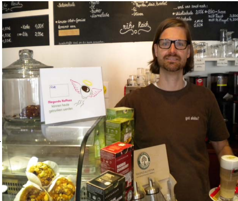
(Abbildung 30: Cafébetreiber bietet den Fliegenden Kaffee an)

Bestellt man in einem teilnehmenden Café in Berlin, Flensburg, Lüneburg oder St. Gallen einen „Fliegenden Kaffee“, zahlt man zwei Tassen Kaffee, trinkt aber nur einen Kaffee selbst. Der andere Kaffee geht auf eine Liste von offenen 'Fliegenden Kaffees'. Diese können von Gästen, die 'knapp bei Kasse' sind, getrunken werden. So kann er kostenlos einen Kaffee genießen, Zeitung lesen oder sich mit Freunden treffen. Durch den Aufkleber 'Hier gibt es den Fliegenden Kaffee' an den Türen der teilnehmenden Cafés zeigt der Cafébetreiber: dieses Café ist offen für Pluralität! 94