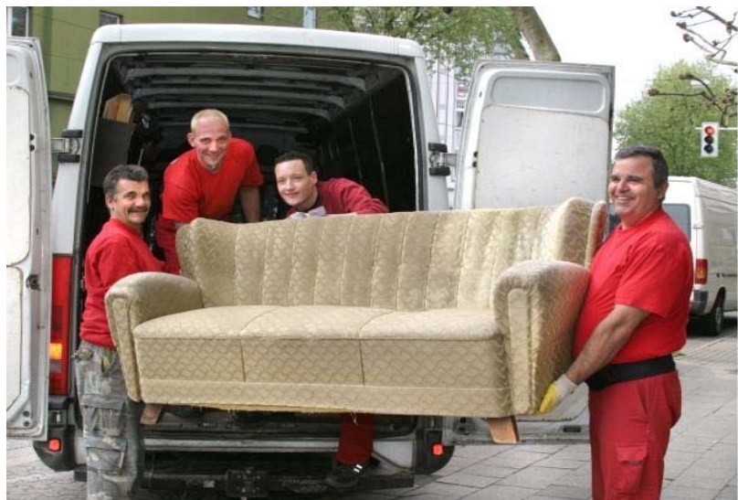
(Abbildung 28: Umzugsteam Bodo im Einsatz)

Bodo 78 bietet Umzugshilfen, Wohnungsaufösungen und Entsorgungen an. Das Projekt versteht sich als Beschäftigungsinitiative, die Langzeitarbeitslosen und ehemaligen Verkäufern des Straßenmagazins (aus Bochum, Dortmund und Umgebung) einen Neueinstieg ins Berufsleben ermöglicht. 79