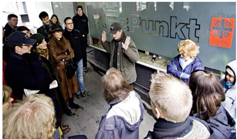
(Abbildung 3: Stadtführer der Nebenschauplätze;)