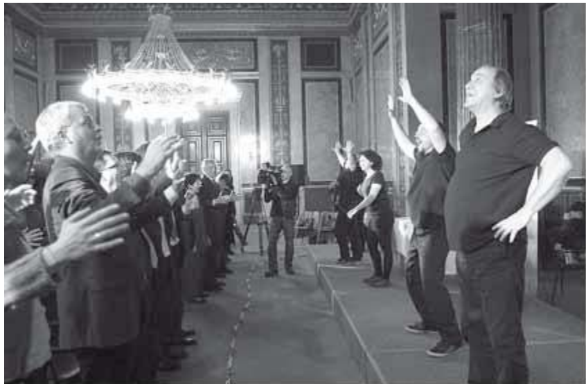
(Abbildung 7: „Kein Kies zum Kurve kratzen“ wird beklatscht)

Armutskonferenz und vielen regionalen Kooperationspartner_innen durch Österreich. Es werden dabei Lösungsansätze für die Vermeidung und Bekämpfung von Armut und Ausgrenzung unter Einbeziehung von unmittelbar Betroffenen und der breiten Bevölkerung entwickelt. Über einhundert Vorschläge und Forderungen wurden auf diese Weise entwickelt. 16