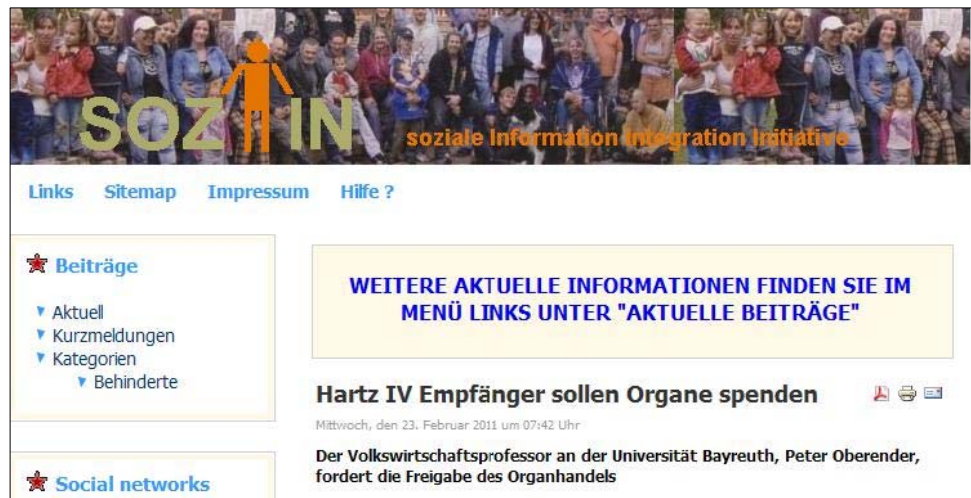
(Abbildung 25: Screenshot vom Blog sozin.de vom 16. März 2012)

Sozin informiert über Themen aus den Bereichen Veranstaltung und soziale Informationen. Die Seite wird vom Armutsnetzwerk betrieben und gepflegt. 66