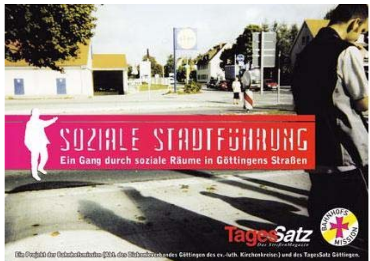
(Abbildung 5: Soziale Stadtführung 'Tagessatz')

Stationen sind u. a. die Redaktion des Straßenmagazins Tagessatz, die Göttinger Tafel, das Projekt Blechtrommel der Jugendhilfe Göttingen, das Männerwohnheim der Heilsarmee, der Verein Kore, das Migrationszentrum für Stadt und Landkreis, die sozialpsychiatrische Beratungsstelle Shelter, das Drogenberatungszentrum für illegale Drogen des Diakonieverbandes, der Mittagstisch für Obdachlose und Arme der katholischen St.-Michael-Gemeinde, die Arbeiterwohlfahrt mit ihrer Schuldnerberatung, der Jobclub 50+, das Jobcenter Jugend, das städtische Jugendprojekt Kontur, die Ambulante Hilfe (ehemals Wohnungsnothilfe), die Straßensozialarbeit des Diakonieverbandes Göttingen, die therapeutische Jugendhilfeeinrichtung Wohnen und Betreuung des Sozialpädagogischen Schüler- und Lehrlingszentrums und die Bahnmissionsmission. 13