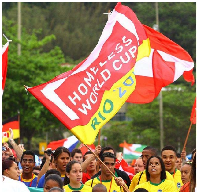
Abbildung 16: Fans beim Homeless World Cup in Rio2010

Die Fußballweltmeisterschaft der Obdachlosen (engl.: Homeless-World-Cup) ist ein vom International Network of Street Newspapers (INSP) ausgerichtetes internationales Straßenfußball-Turnier, das seit 2003 jährlich ausgetragen wird. Teilnahmeberechtigt ist man einmal im Leben. Spieler müssen mindestens 16 Jahre alt sein.