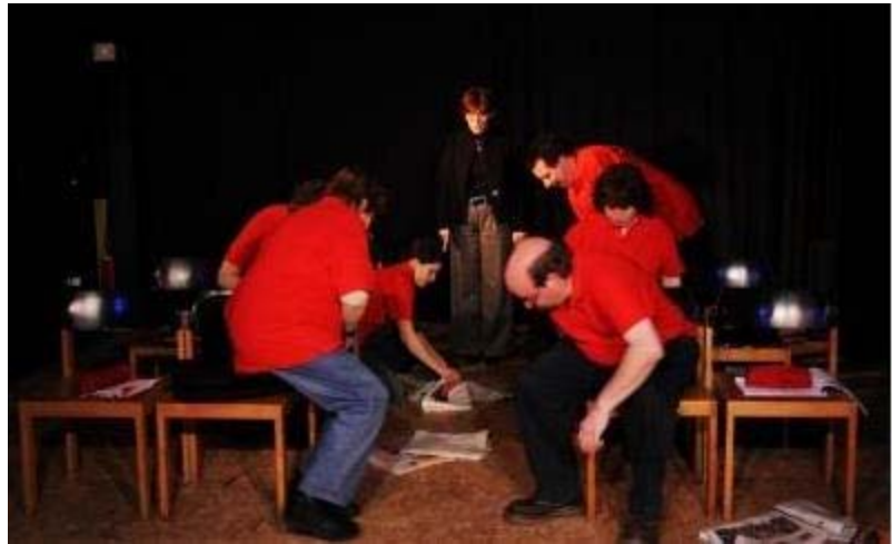
(Abbildung 8: Trott!war-Theater-Team)

Trott!war ist eine Stuttgarter Straßenzeitung. 17 Das Trott!war-Theater-Team wird von professionellen Regisseuren gecoacht. Die Hauptrollen spielen die Verkäufer. Es sollen neue Fähigkeiten entdeckt und geschult werden, aber auch anderen Rollen erlebt werden. Der Platz am Rand der Gesellschaft wird gegen den im Rampenlicht (wenn auch nur zeitweise) eingetauscht. 18