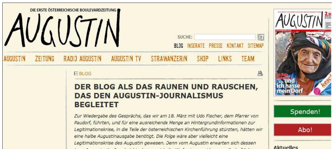
(Abbildung 22: Screenshot vom Augustin-Blog vom 13. März 2012)