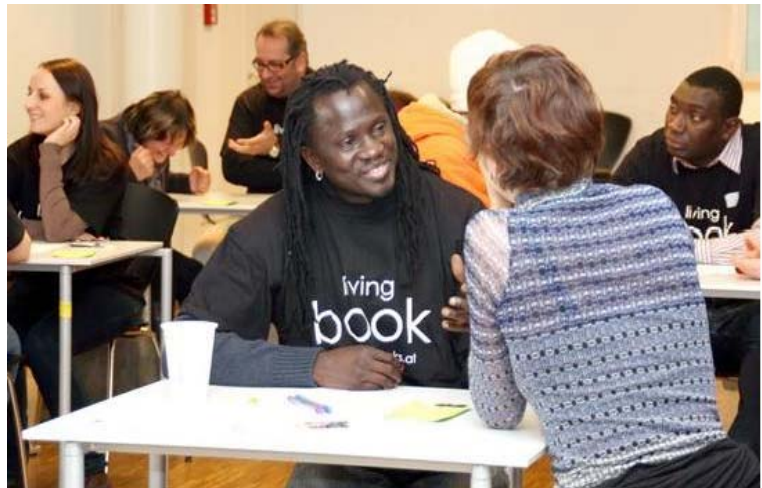
(Abbildung 13: Living Books erzählen)

Menschen erzählen aus ihrem Leben. Sie sind sogenannte 'Living Books'. Menschen können für halbstündige Gespräche (und länger) gebucht werden. Verschiedene Lebenswelten werden so aus erster Hand zugänglich gemacht. So erleben (auch) Randgruppen wertschätzende Kontakte mit ihrer Umwelt, der offene Austausch zwischen Bevölkerungsgruppen wird gefördert und Vorurteile abgebaut. 33