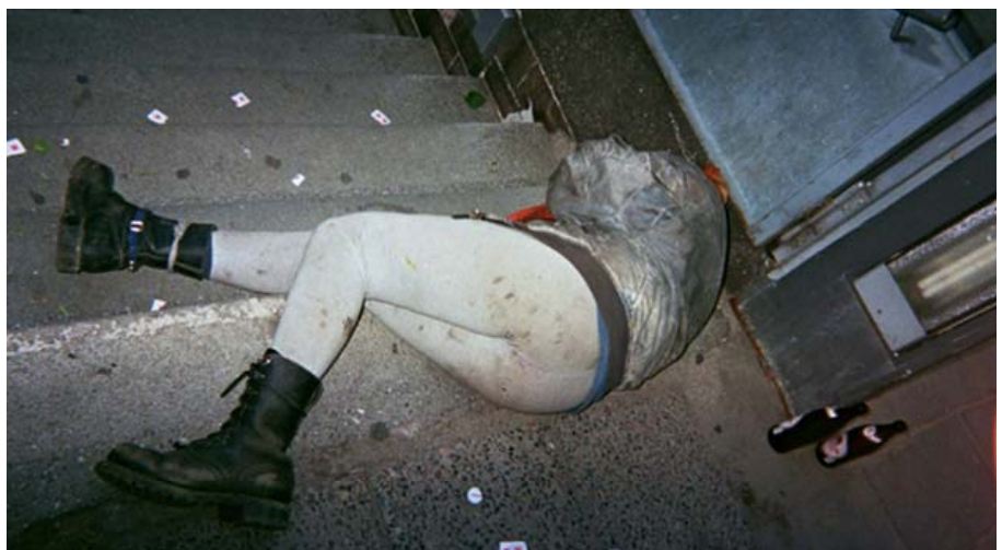
(Abbildung 15: 'Auf der Kippe' aus der Bilderreihe Off-Road-Kids)

Straßenkinder fotografieren ihre Welt“ zu sehen. 36