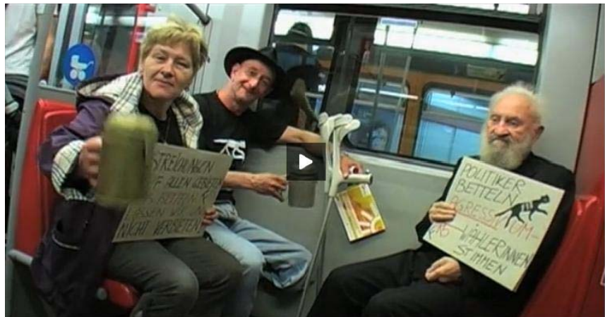
(Abbildung 21: Screenshot vom Augustin-TV-Beitrag am 08.03.2012 auf www.okto.tv/augustin )

Seit Dezember 2005 sendet Augustin TV (Sender der „ersten österreichischen Boulevardzeitung Augustin“) auf dem Community TV Sender OKTO. Gezeigt werden Reportagen und Portraits sowie Beiträge zu den Themen Arbeitslosigkeit, Armut, Ausgrenzung, Integration und Empowerment. 59