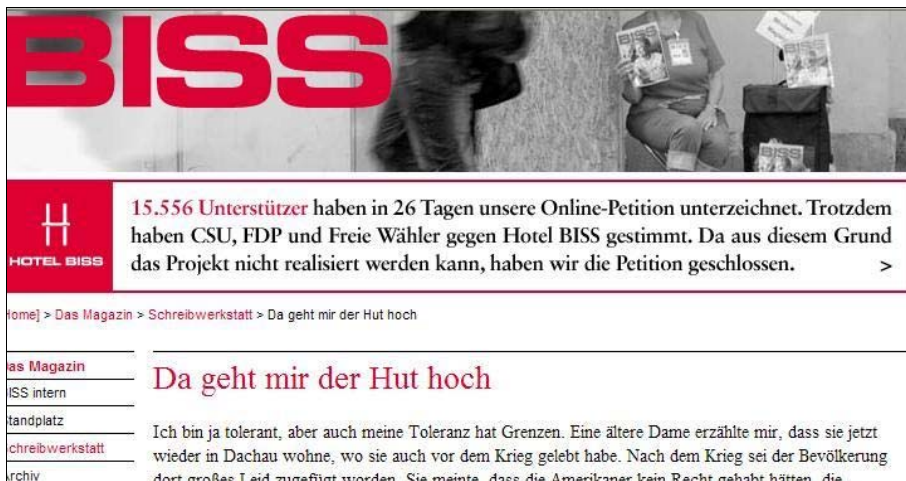
(Abbildung 24: Screenshot von der 'Schreibwerkstatt Bürger in Sozialen Schwierigkeiten' vom 13. März 2012)