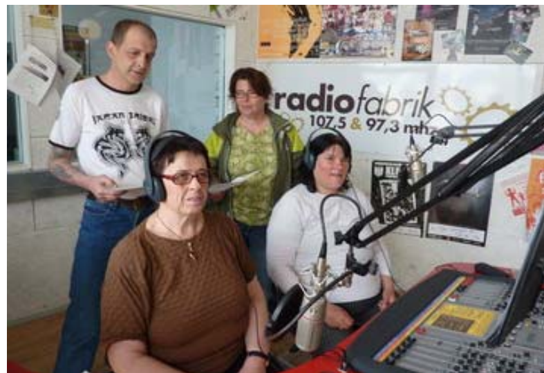
Abbildung 20: Apropos-Sendungsteam

Die Verkäuferinnen und Verkäufer der Salzburger Straßenzeitung interviewen sich gegenseitig für das Apropos Radio. Themen sind u. a. Verkaufsalltag, aber auch einige Einblicke in das Privatleben werden gewährt. Weiterhin werden Gäste aus dem Salzburger Kultur- und Sozialleben eingeladen und interviewt. 54