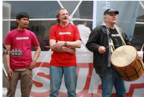
(Abbildung 11: Der Schweizer Surprise Straßenchor )

Der Surprise Straßenchor ist offen für Menschen, die gerne singen möchten, sich aber aus finanziellen Gründen keine Chorteilnahme leisten können. Der Chor singt deutsche, spanische und afrikanische Lieder. 25