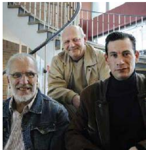
(Abbildung 1: Die Stadtführer vom Schicht-Wechsel)

Seit 2008 zeigen die Mitarbeiter_innen gewöhnliche Plätze und Häuser, die Geschichten erzählen. Bei einem etwa zweistündigen Spaziergang werden Anlaufstellen für sozial benachteiligte Mitbürger in Nürnberg besucht. Menschen, die dort arbeiten, stellen sich und ihre Einrichtungen vor, und die Stadtführer berichten von ihren eigenen Erfahrungen. Es findet ein Einblick in den Alltag von Armut und gesellschaftlicher Ausgrenzung statt. 6