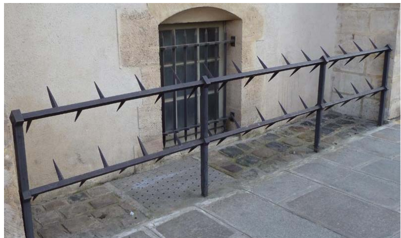
(Abbildung 31: „Kein Schlafplatz für Obdachlose“)

Es werden Plätze fotografiert und auf der projekteigenen Website veröffentlicht 95 , die (absichtlich) so gestaltet wurden, dass kein Obdachloser dort schlafen kann.