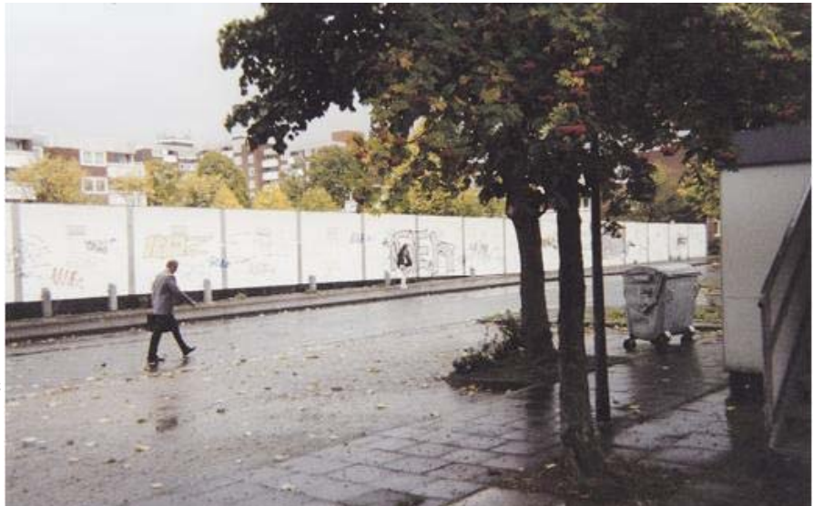
(Abbildung 14: Mensch auf der Straße; Bildquelle: André Illing, www.einwegleben.de)

Neben einem Porträtfoto ist jeweils ein kurzer Lebenslauf beigefügt. Die Publikation vermittelt somit einen Einblick in das facettenreiche Leben auf der Straße. Das Leben auf der Straße soll somit ins Blickfeld der Öffentlichkeit gerückt werden. 35